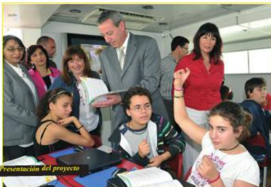
Presentación del proyecto

Un centenar de centros educativos de Secundaria de Andalucía participan en un bus itinerante sobre conciliación familiar