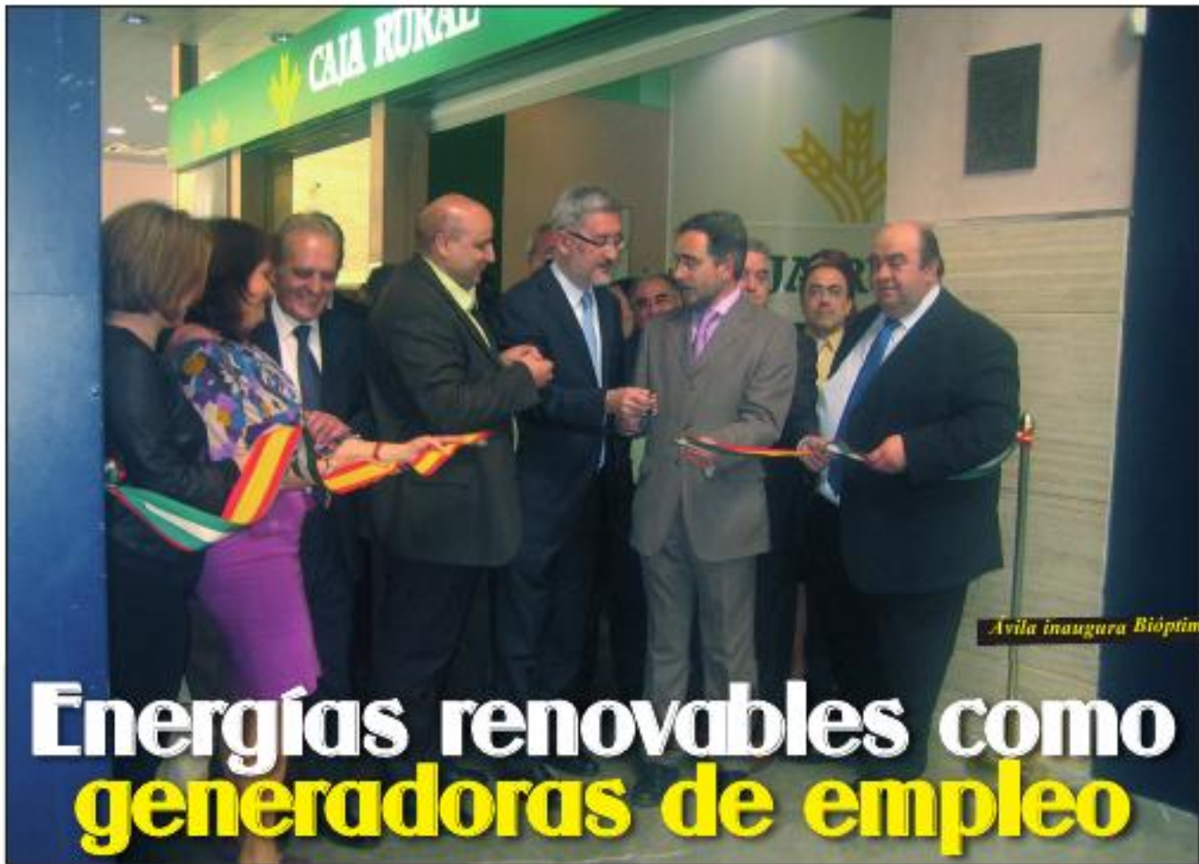
Ávila inaugura Bióptima 2010