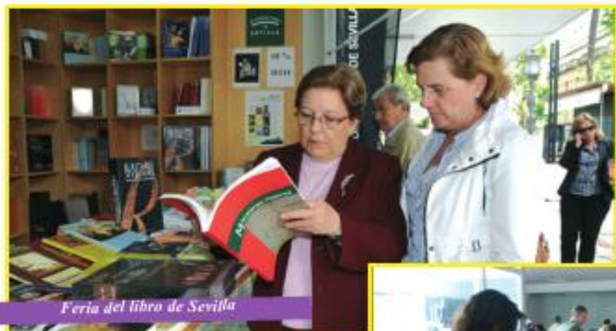
Feria del libro de Sevilla

La Diputación de Sevilla clausuró el mes pasado la edición 2010 de 'El Placer de Leer', que en esta ocasión contó con un club de lectura 2.0. y también estuvo presente en la Feria del Libro de Sevilla con un stand propio